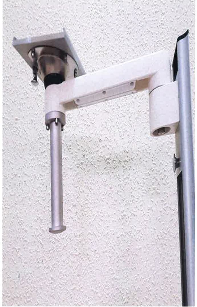
DENEY NUMUNESİ FOTOĞRAFLARI / PHOTOS OF TEST SAMPLE