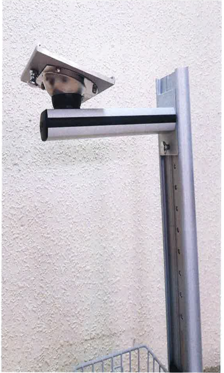
DENEY NUMUNESİ FOTOĞRAFLARI / PHOTOS OF TEST SAMPLE